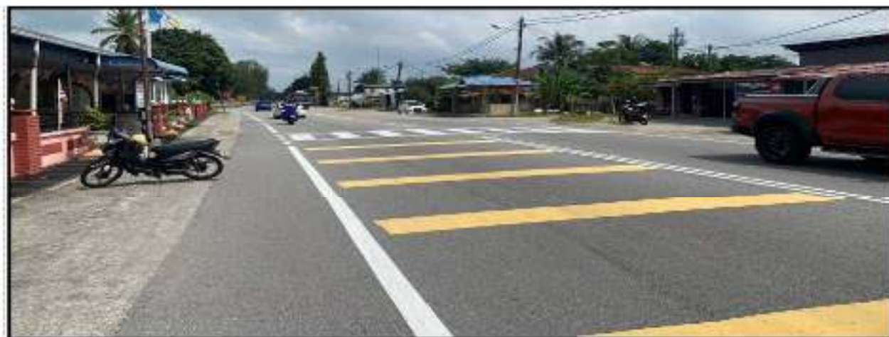
Gambar 2: Garisan jalan, garisan putih melintang dan petak kuning yang telah siap dilaksanakan di hadapan Masjid Bagan Lebai Tahir.