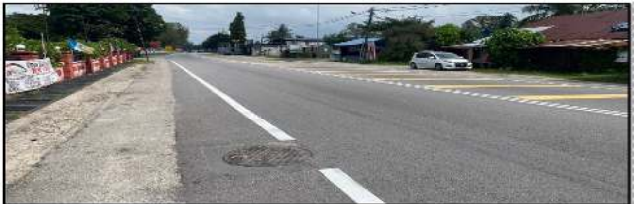
Gambar 5. Garisan jalan, garisan putih melintang dan petak kuning yang telah siap dilaksanakan di hadapan Masjid Baglan Lobai Tahir.