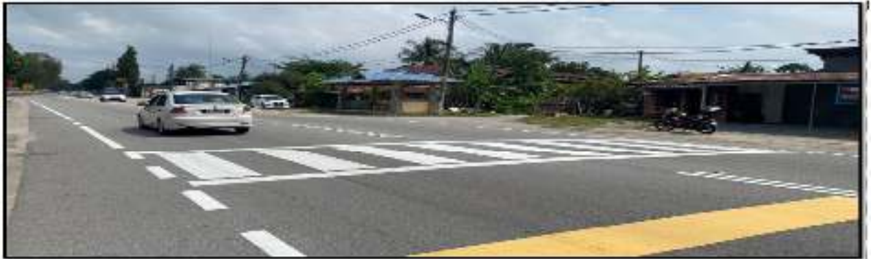
Gambar 3. Garisan jalan, garisan putih melintang dan petak kuning yang telah siap dilaksanakan di hadapan Masjid Baglan Lobai Tahir.