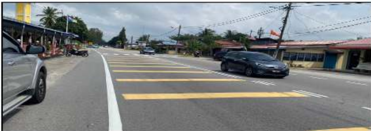
Gambar 1: Garisan jalan, garisan putih melintang dan petak kuning yang telah siap dilaksanakan di hadapan Masjid Bagan Lebai Tahir.