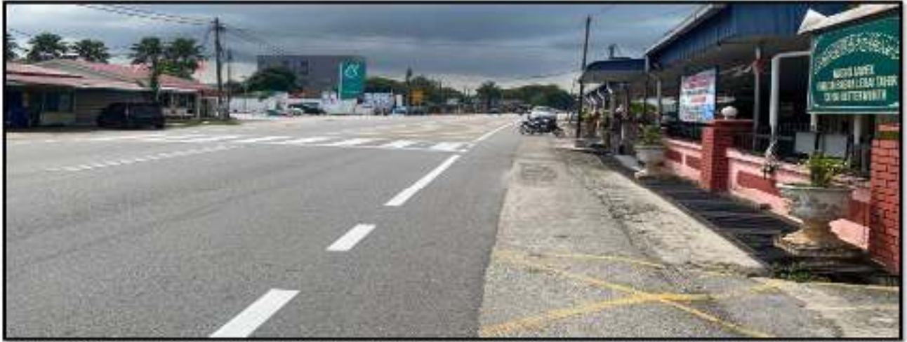
Gambar 8: Garisan jalan, garisan putih melintang dan petak kuning yang telah siap dilaksanakan di hadapan Masjid Bagan Lebai Tahir.