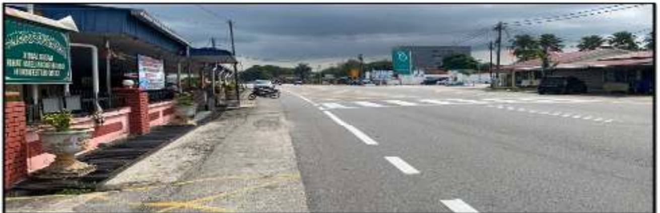
Gambar 4. Garisan jalan, garisan putih melintang dan petak kuning yang telah siap dilaksanakan di hadapan Masjid Baglan Lobai Tahir.